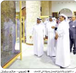
د. الكواري والشيخ فيصل وجولة في المتحف