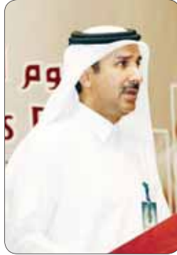
الشيخ حمد بن جبر آل ثاني