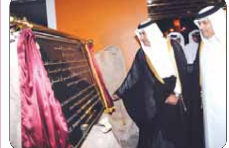
معالي رئيس الوزراء أجاز الستار معلنا افتتاح المدينة الملتية