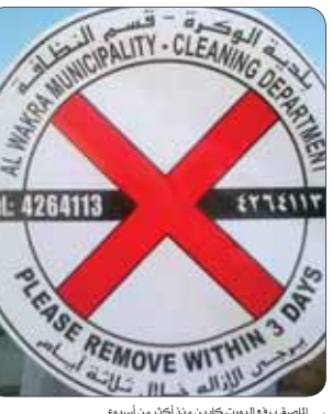
المنصق برفق البورت كاتين منذ أكثر من أسبوع