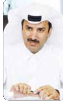
الشيخ حمد بن جبر بن جاسم آل ثاني

نظم جهاز الإحصاء بقره أمس يوماً مفتوحاً بمناسبة اليوم العالمي للإحصاء وإعلان النتائج النهائية للتعهد العام للسكن والسكان والمنشآت ٢٠١٠، واستقبل مسؤولو الجهاز أسس عدداً من المسؤولين من مختلف الجهات الحكومية والخاصة، وعدد من طلاب المدارس.