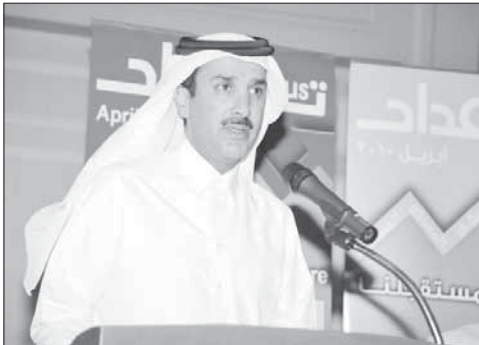
الشيخ حمد يلقى كلمته للحضور