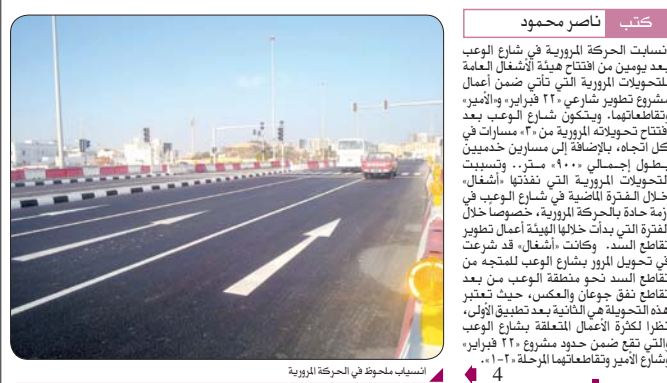
انسياب ملحوظ في الحركة المرورية