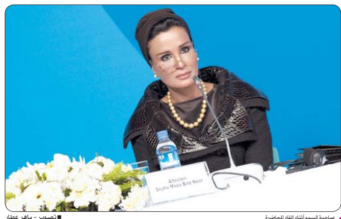
صاحبة السمو أثناء إلقاء المحاضرة

استقبلت باسطنبول -قنا- تلبية لدعوة من اللجنة الوطنية التركية لتحالف الحضارات، تفضلت صاحبة السمو الشقيقة سمو بنت ناصر المستدة، مساء أمس، بقصر «دولة بيجدة» بإلقاء محاضرة بعنوان «تحالف الحضارات والشرق الأوسط» ضمن فعالية محاضرات استقبلت تحالف الحضارات.