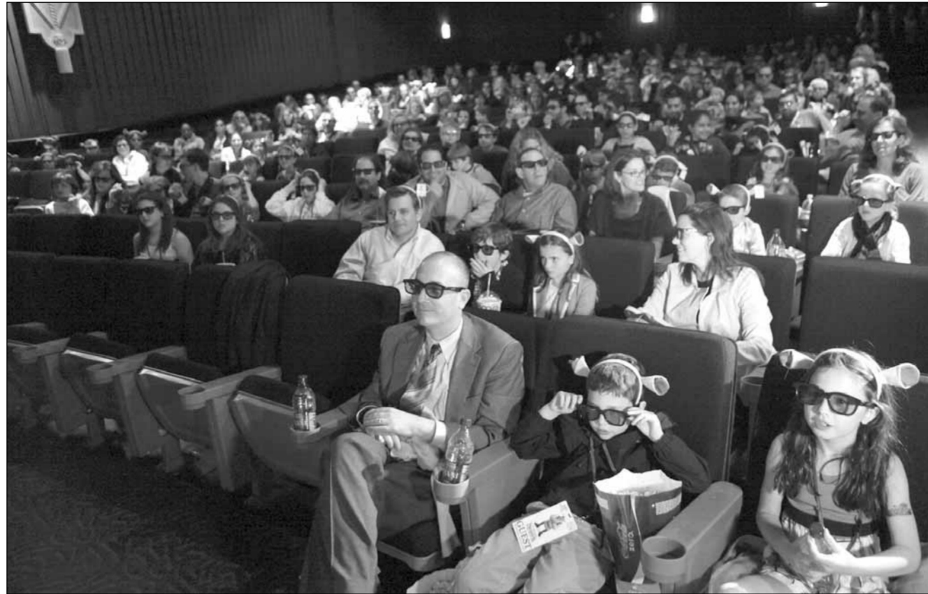
حشد من الحضور