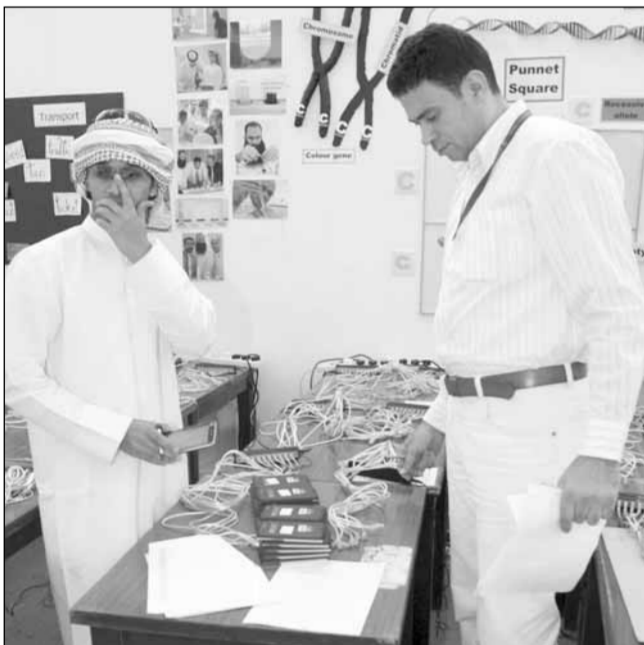
خلال الإعداد الفني لأجهزة التعداد