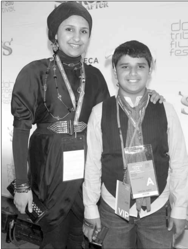
الدانة مع أحد الأطفال