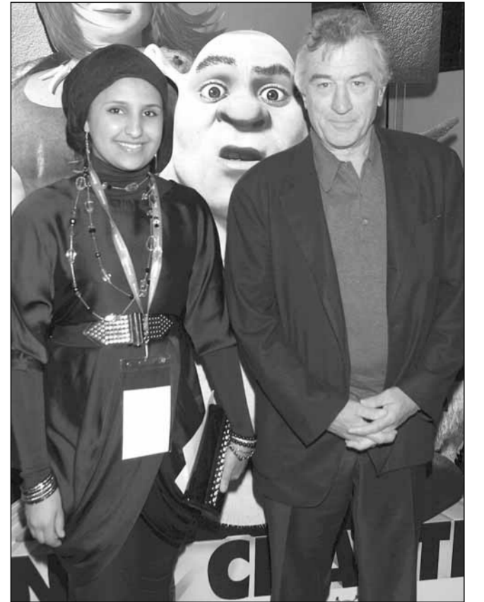
الدانة الدوسري مع روبرت دينيرو