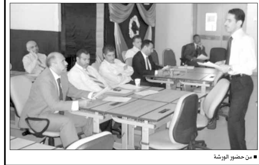
من حضور الورشة

وأكد سعادة النائب صاحب الترخيص ومدير المدرسة أن الأنشطة لها أكبر الأثر في تعزيز القيم وأنها تساهم في تنفيذ التعليم داخل غرفة الصف من خلال ما يتكسبه الطلاب من خبرات حياتية، وشدد على أن المدرسة كانت وعلى مدار العامين الماضيين من أوثق المدارس اتصالاً بالمجتمع المحلي حيث تابعنا فعالياته أولاً بأول ولم نتردد في تلبية كافة الدعوات التي توجهها لنا المدارس الأخرى، وأضاف: المدرسة قد سطرت سجلاً حلالاً من الأنشطة المتنوعة في مختلف المجالات وأشركت معظم طلابها من المرحلتين فيها، وقد حقق الطلاب مستويات عالية ودرجات مرتفعة في أدائهم، وأشار النائب إلى أن الاهتمام بالأنشطة أبداً لا يعوق توجه المدرسة قديماً في تنفيذ رسالتها الموضوعة ورؤيتها بل إن الأنشطة التي قمنا بها خلال العامين لا شك أنها حققت أهدافاً تخدم العملية التعليمية أيما خدمة وتسهم