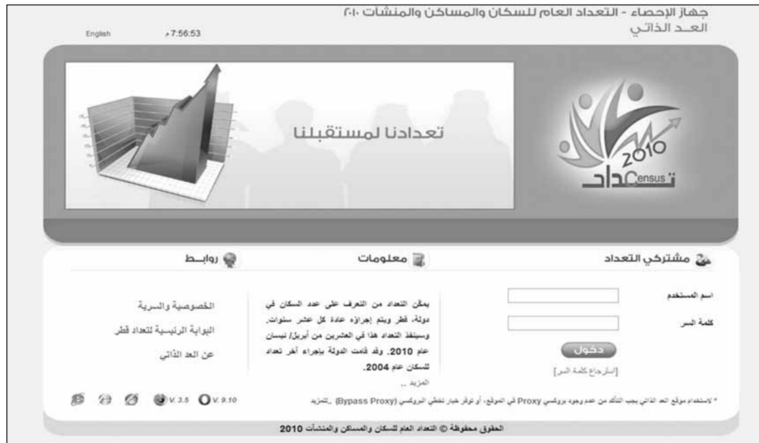
الصفحة الإلكترونية الخاصة بالتسجيل على الإنترنت

الأسرة وغيرها. ومن ناحية أخرى تواصلت عمليات التعداد العام للسكان والمنشآت في الدولة لليوم السابع على التوالي وذلك بتسجيل ٢٩٠٠ أسرة في الدوحة وخارجها من قبل مندوبي التعداد منها ٢٥٠٠ عبر الإنترنت، وبهذه المناسبة أشاد سعادة الشيخ حمد بن جبر بن جاسم آل ثاني رئيس جهاز الإحصاء بالأقبال الهائل من كافة المواطنين والمقيمين والتعاون الكبير مع الجهاز ومندوبي التعداد للإدلاء بالبيانات المطلوبة.