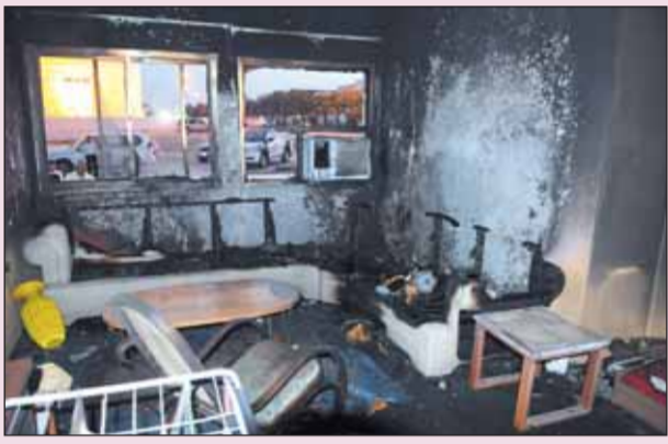
الدمار الذي لحق بالداخل في فيلا بمنطقة المطار

الحريق. ودعت الإدارة العامة للدفاع المدني أصحاب العقارات بضرورة الالتزام بإجراءات السلامة والوقاية حتى لا تتعرض حياة السكان للخطر . وشرعت الجهات المختصة في التحقيقات لمعرفة الأسباب وراء اندلاع الحريق.