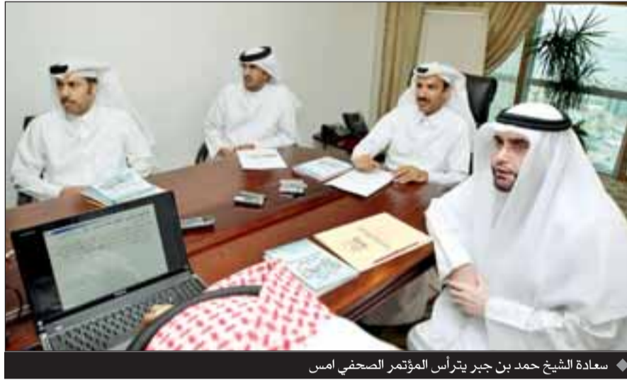
سعادة الشيخ حمد بن جبر يترأس المؤتمر الصحفي أمس

الاستدامة البيئية، وإقامة شراكة عالمية من أجل التنمية". وفيما يتعلق ببقية الأهداف مثل تعزيز المساواة بين الجنسين وتمكين المرأة، أشار سعادته إلى أن هناك تقدماً ملموساً على هذا الصعيد. غير أنه نبه إلى أن الوصول إلى تلك الأهداف يتطلب تغييرات جوهرية في الوعي الاجتماعي والعادات والتقاليد والقيم السائدة وهذا يحتاج بالتالي إلى مرور وقت كاف لإحداث التغييرات المذكورة من أجل تحقيق غاياتها". ولفت سعادة الشيخ حمد بن جبر آل ثاني إلى أن التقرير الثالث حول التقدم المحرز في تحقيق الأهداف الإنمائية للألفية الذي أعده جهاز الإحصاء بالتعاون مع اللجنة الدائمة للسكان والتنسيق مع البرنامج الإنمائي الإقليمي للأمم المتحدة ركز هذه المرة على الهدف الثامن الذي يتعلق بإقامة شراكة عالمية من أجل التنمية.