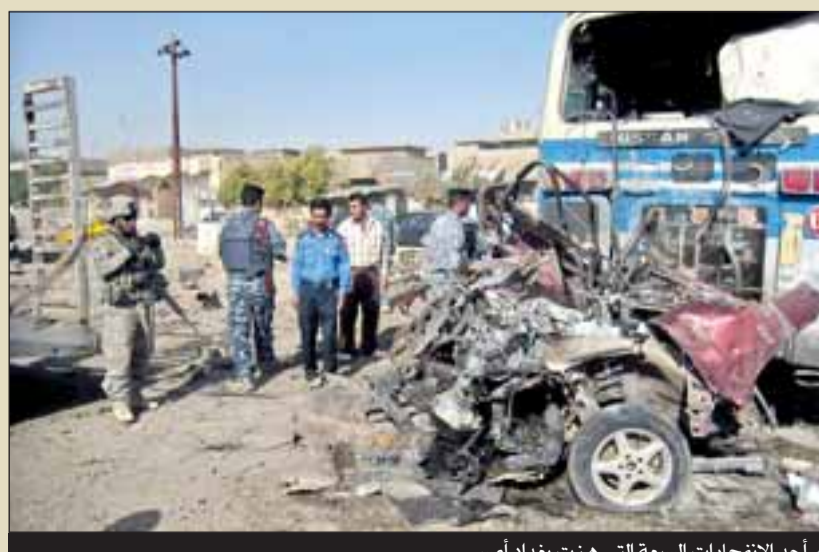
أحد الانفجارات السبعة التي هزت بغداد أمس